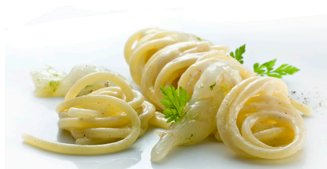
Food Line firmata Heinz Beck