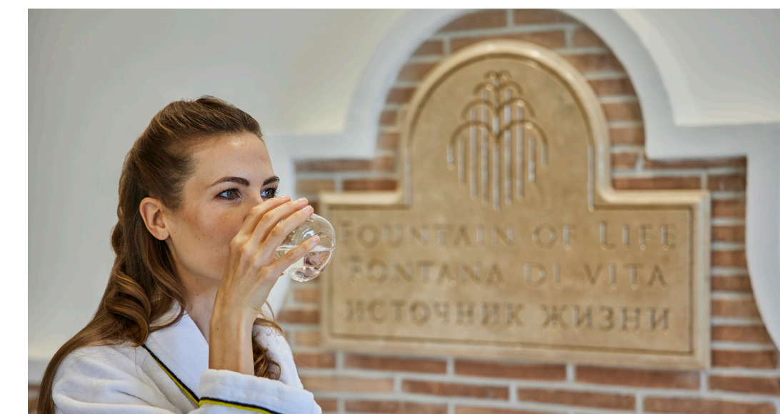
La terapeutica Acqua di Fiuggi