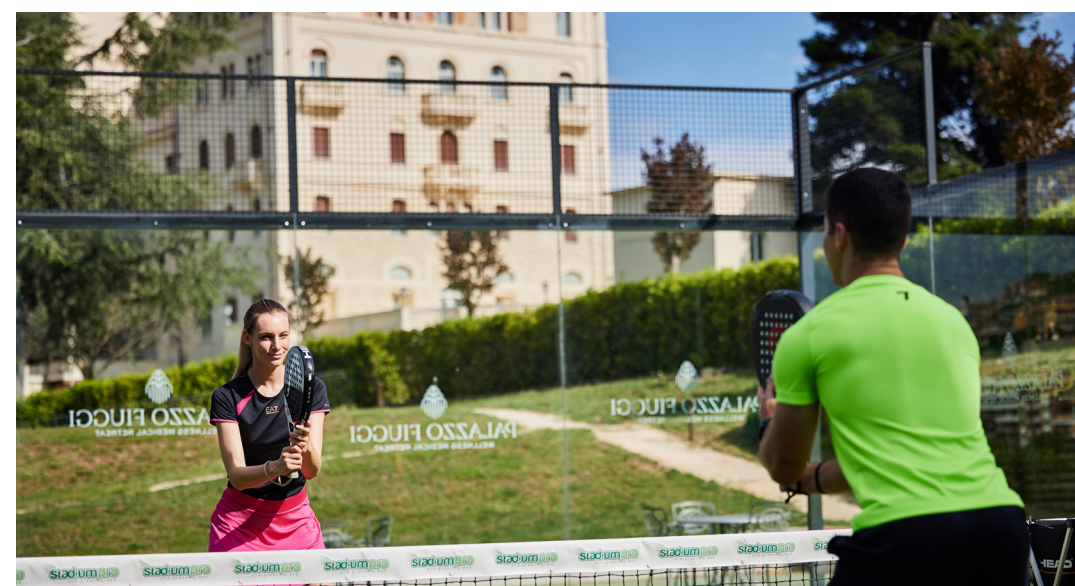
Campi da Tennis e Padel

Soggiorno in camera Charme, occupazione doppia: € 2.870